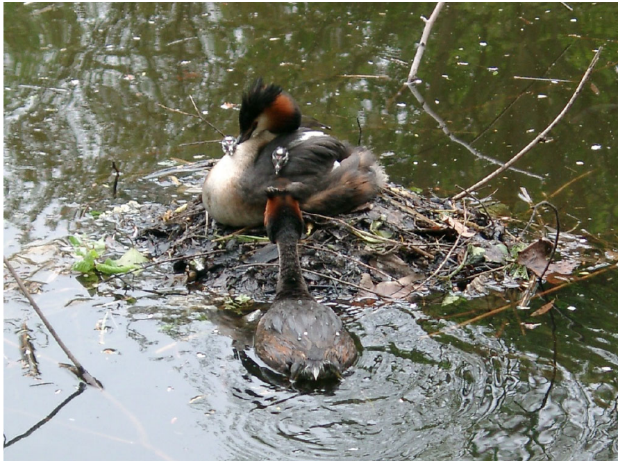
Haubentaucher am Isebek

und für die Verteidigung direkter Demokratie in Hamburg!