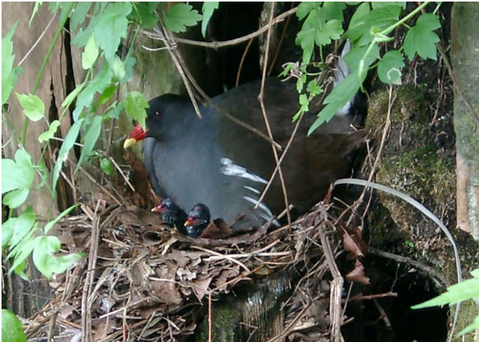
Teichralle am Isebek

und für die Verteidigung direkter Demokratie in Hamburg!