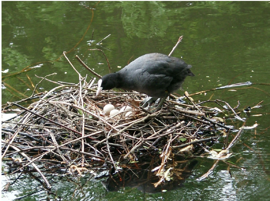
Blässralle am Isebek

und für die Verteidigung direkter Demokratie in Hamburg!